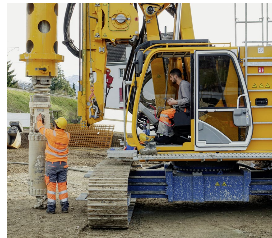
Das tonnenschwere Bohrwerkzeug wird gewechselt. Im oberen Bereich steht weicher Boden an. Sobald der Bohrer auf felsigen Untergrund stösst, muss der Bohrkopf erneut gewechselt werden.

Die Firma Swissbohr besteht seit 15 Jahren. 20 Mitarbeiter bilden gleichzeitig je-