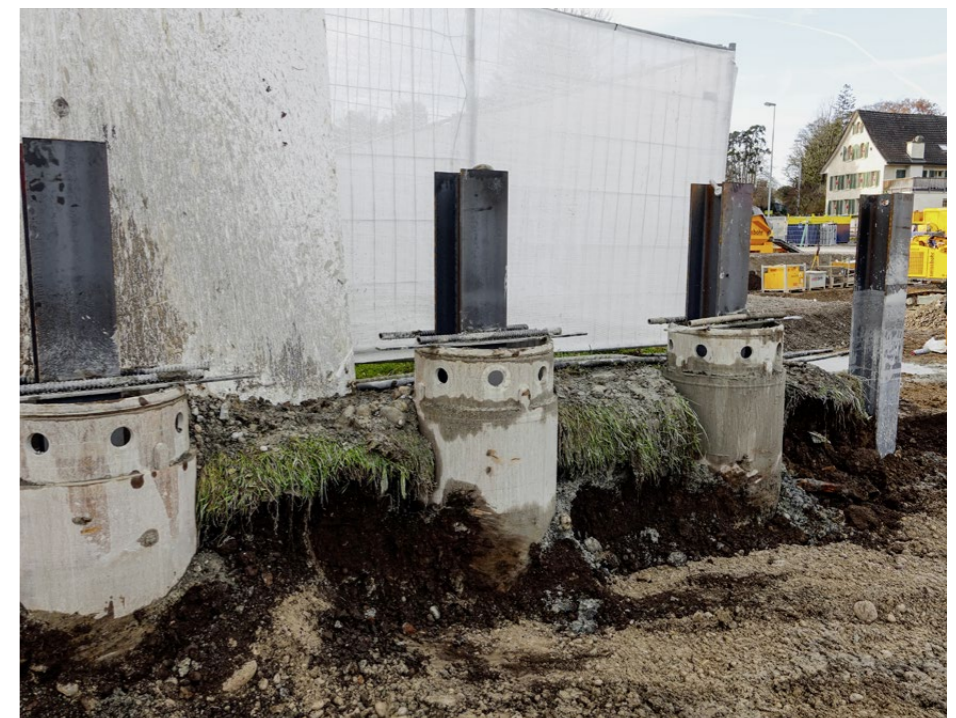
Die Rühlwandträger werden später in die Aussenwand eines der Mehrfamilienhäuser zum einhäutigen Schalen integriert. Die Verrohrung wird nach dem Erhärten des Betons gezogen.

Das Drehbohrgerät ist mit Seilvorschub ausgerüstet. Mit Seilvorschub können Löcher bis zu einem Durchmesser von 1000 Millimetern gebohrt werden. Mit dem wahlweise wählbaren Zylindervorschub wären sogar Durchmesser bis 1180 Millimeter möglich. Mit Seilvorschub kann die BG 15 H VL auch mit dem Schneckenortbetonverfahren (SOB) arbeiten, das vor allem bei Pfahlgründungen in lockeren Böden zum Einsatz kommt, die am Zürichsee oft anzutreffen sind. Bei diesem Verfahren werden lange Schnecken in einem Stück in den Boden eingedreht. Damit ist eine sehr hohe Leistung möglich. Das Material wird kontinuierlich über die Wendel gefördert. Beim Ziehen der Schne-