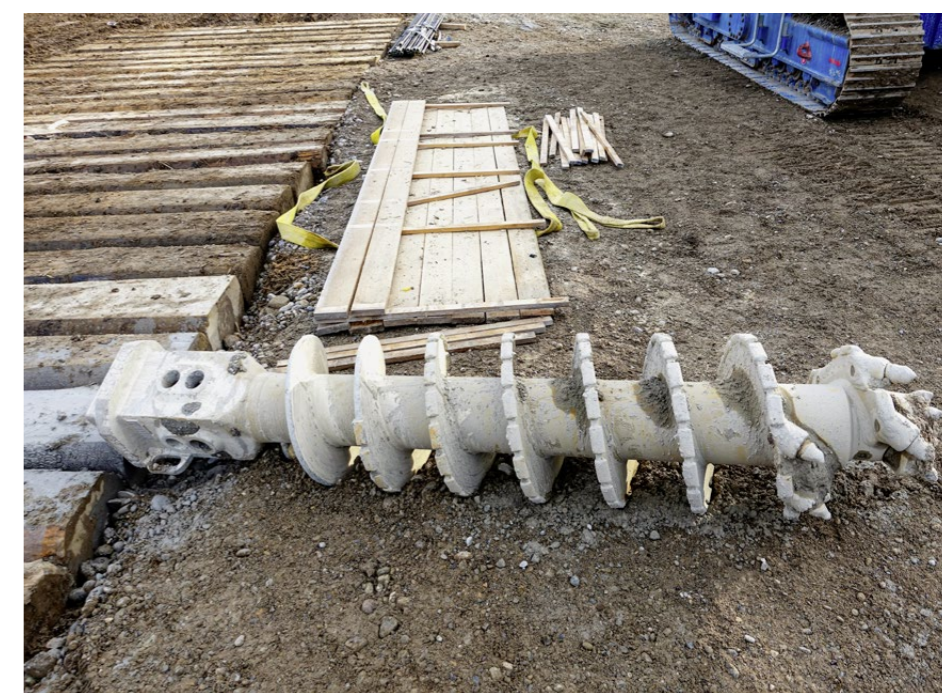
Der zweite Bohrkopf liegt für den Austausch bereit: Er ist rund zwei Meter lang und wiegt 1,4 Tonnen.

für innerstädtische Baumassnahmen, also beim Bauen im beengten Umfeld, sehr gut einsetzbar. Dabei kann die Bohrmaschine auch in sensiblen Zonen zum Einsatz kommen. Denn durch eine Kombination mit der Lärmreduzierungstechnologie «Silent Mode» erfolgen die Arbeiten