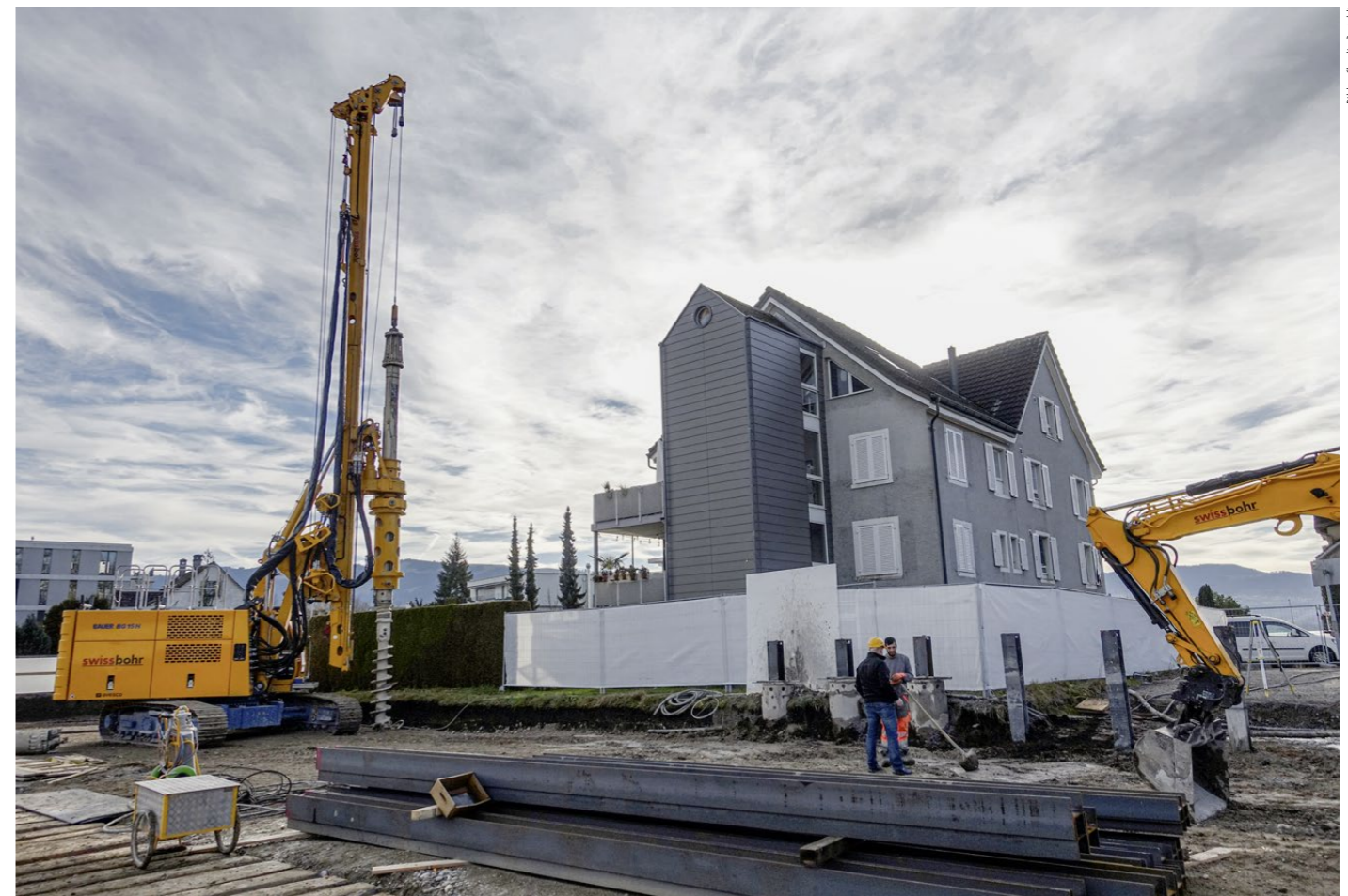
Vorbereitungen für weitere Rühlwandträger-Bohrungen zur Baugrubensicherung der angrenzenden Überbauung. Die ersten Träger wurden bereits gesetzt.

Das Projekt sieht Bohrlöcher mit Verrohrung vor. Jede Bohrung hat einen Innendurchmesser von 540 Millimetern, der Aussendurchmesser beträgt 620 Millimeter. Das Ausbohren der Verrohrung erfolgt