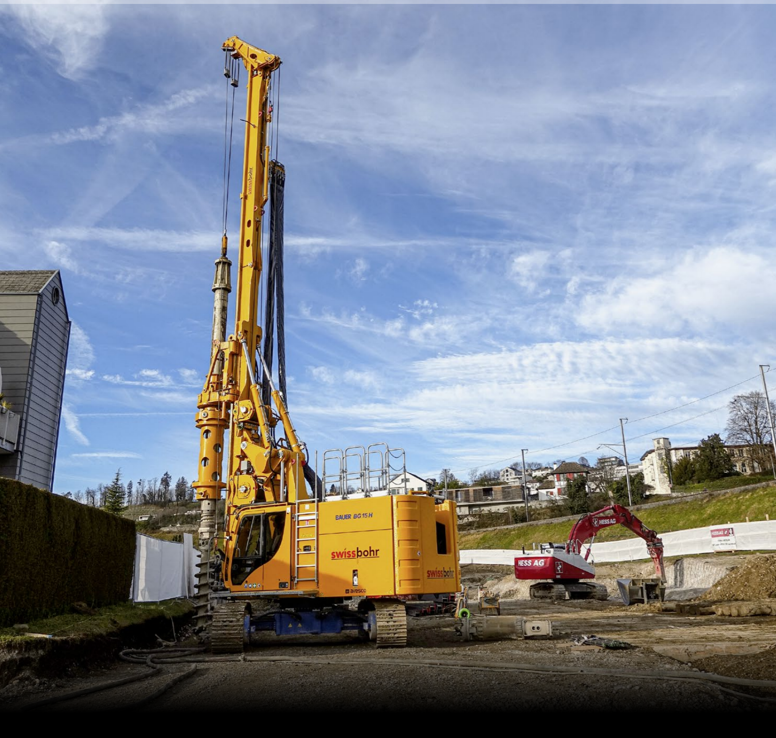
Das neue Grossbohrgerät Bauer BG 15 H VL bei seinem dritten Einsatz in Rapperswil-Jona. Zur Sicherung einer angrenzenden Überbauung mussten Bohrungen für eine Rühlwand erstellt werden.

E in weisser Zaun versperrt die Einsicht zur Baustelle. Dahinter hört man das monotone Brummen der Baumaschinen. Zwei Bagger heben die Baugrube unterhalb des Bahndamms aus, tragen das Erdreich ab, schieben das Material für den Abtransport zusammen und ebnen das Gelände. Nur ein hoher Maschinenmast ragt weithin sichtbar über die Absperrung der Baustelle. Er gehört zum Bohrgerät Bauer BG 15 H VL. Mit der Baumaschine werden momentan Rühlwandträger-Bohrungen vorgenommen. Sie dienen zur Absicherung der Baugrube, die an der westlichen Aussenseite an eine bestehende Bebauung grenzt.